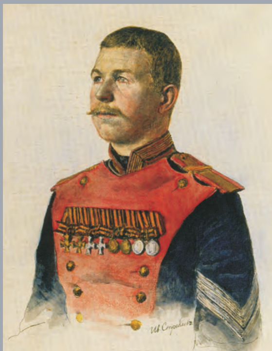
Полный Георгиевский кавалер. Неизвестный подпрапорщик Лейб-гвардии 2-го Стрелкового Царскосельского полка. Художник И. Стреблов. 1916–1917 гг.