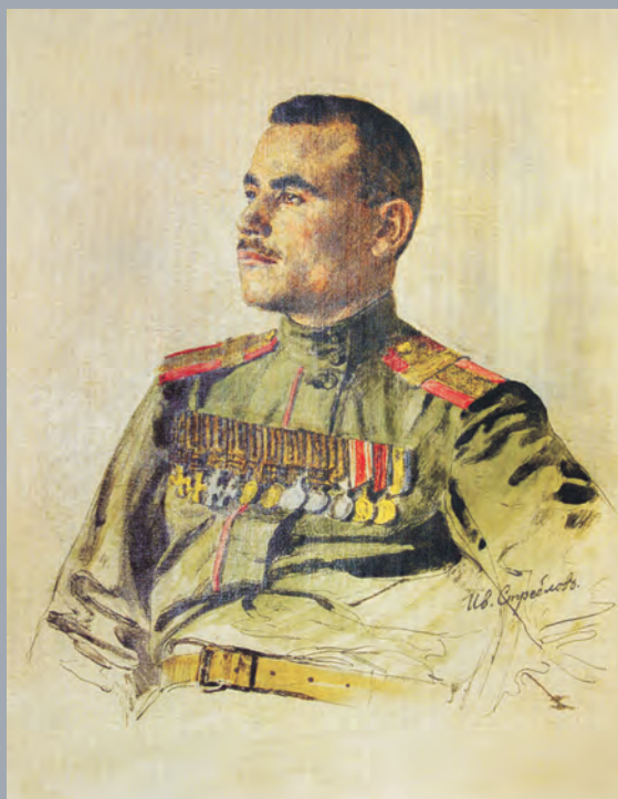
Полный Георгиевский кавалер. Неизвестный подпрапорщик Лейб-гвардии 1-го Стрелкового Его Величества полка. Художник И. Стреблов. 1916–1917 гг.