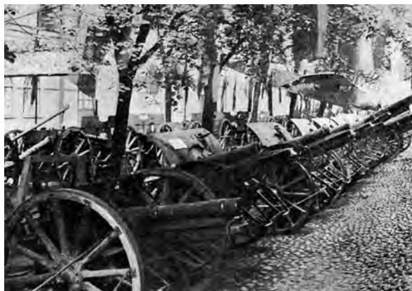
Ряды захваченных германских и австрийских орудий