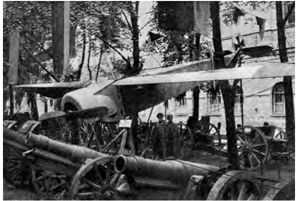
Германский аэроплан системы «Фоккер» в числе русских трофеев

Осенью 1919 года Северо-Западная армия под командованием генерала Н. Н. Юденича подошла к окрестностям Петрограда. В спешном порядке началась эвакуация оставшихся художественных ценностей и военных трофеев из Ратной палаты. Скорее всего, часть предметов вновь превра-