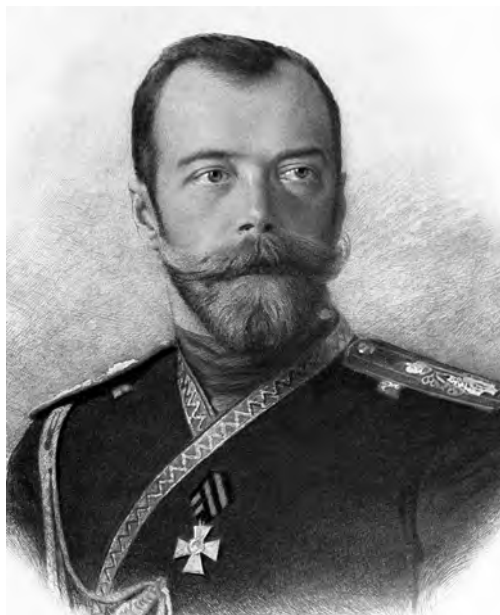
Император Николай II в мундире Лейб-гвардии 4-го Стрелкового Императорской Фамилии полка. Иллюстрация из каталога выставки «Война и наши трофеи». 1915 г.