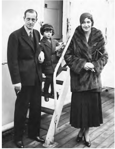
Великий Князь Дмитрий с женой и сыном