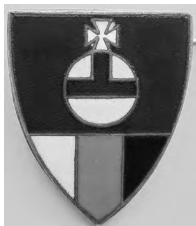
Членский знак Младоросской партии

Положительное и подражательное отношение к итальянскому фашизму всегда сочеталось у младороссов с отрицательным отношением к германскому национал-социализму. А. Гитлера и идеологов нацизма они обвиняли в расизме, русофобии и славянофобии и во всё тех же планах расчленения России. Отрицательное отношение к Третьему Рейху и его политике в сочетании с ожиданием свержения большевиков советскими военными привело к острой конфронтации почти со всеми правыми организациями русской эмиграции. Младороссы упрямо доказывали, что германский фюрер не собирается освобождать