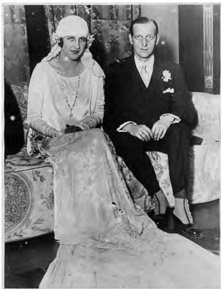
Свадьба Великого Князя Дмитрия и Одри Эммери. 1926 г.

После принятия Кириллом Владимировичем титула Императора Всероссийского 13 сентября 1924 года Великий Князь Дмитрий становится его Августейшим представителем в Париже и департаменте Сена. Эта должность вполне подходила Дмитрию Павловичу, любившему светскую жизнь и обожавшему исполнять представительские функции.