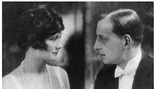
Великий Князь Дмитрий Павлович и Коко Шанель

В этот период первой заботой Великого Князя Дмитрия стало неведомое ему по Петербургу зарабатывание денег. Поэтому когда одна из известных американских фирм-производителей шампанского предложила ему возглавить своё представительство во Франции, он охотно согласился. К тому же Дмитрий Павлович увлёкся романом с будущей «законодательницей мод» Коко Шанель, занимавшим большую часть его времени. Возглавить же, пусть даже и формально, одну из монархических групп означало полную потерю независимости. В таких условиях эффективнее оказалась работа кирилловцев, и в начале 1923 года Великий Князь Дмитрий, под влиянием своего кузена Великого