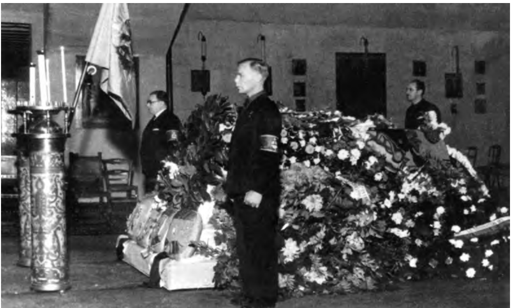
Почётный караул младороссов у гроба Императора Кирилла I Владимировича. 1938 г.

Смерть Императора Кирилла Владимировича в 1938 году лишила Младоросскую партию былой поддержки. Новый Глава Российского Императорского Дома Великий Князь Владимир Кириллович предпочёл не связывать себя с какой-либо конкретной эмигрантской группой. В сложившихся