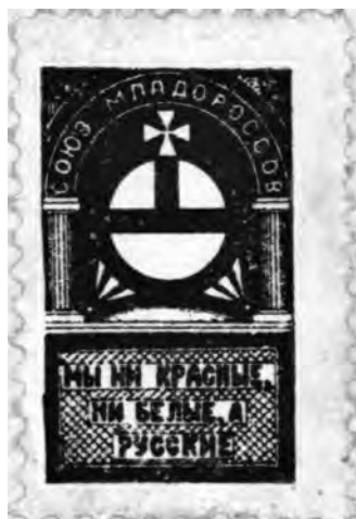
Марка Союза Младороссов с лозунгом: «Мы ни красные, ни белые, а русские!»

ный союз», «Женский союз содействия младоросскому движению», «Инородческая группа русских ассирийцев», «Украинская» и «Белорусская» ячейки и т. д.