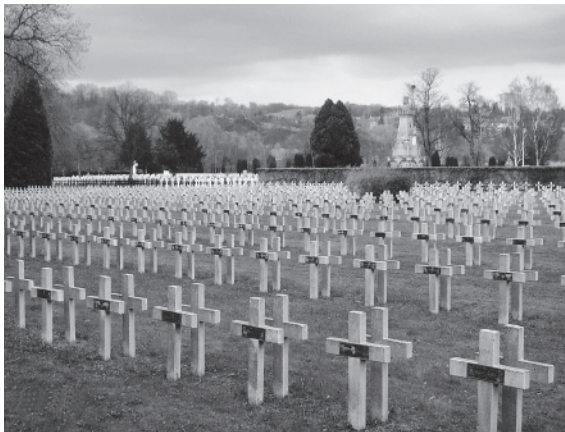
Крупнейший русский военный некрополь Первой мировой войны во Франции в г. Мец (Лотарингия)

ронено 128 русских военнопленных Первой мировой войны, умерших в немецком лагере, по официальным данным числится только 117. Кроме того, официальные французские регистры, как правило, составляют алфавитные списки без разделения по государственной принадлежности.