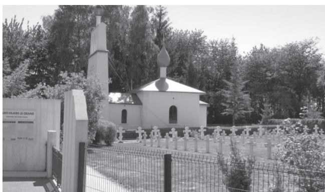
Русский воинский мемориал Первой мировой войны в г. Мурмелон (Шампань)

ных кладбищах зачастую заброшены, запущены (как братская могила в Камье) и рискуют попасть под снос — во Франции места на кладбищах арендуются и по истечении срока могут быть снесены.