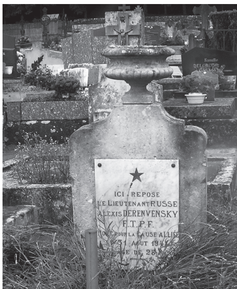
Могила лейтенанта советской армии Алексея Деренвенского (вернее всего, Деревенского). Сена-и-Марна