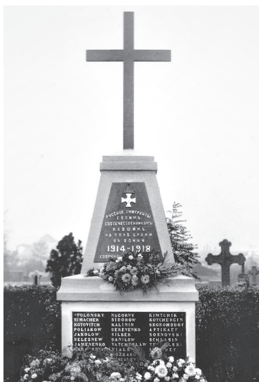
Несохранившийся памятник русским солдатам, погибшим во Франции, установленный в ноябре 1927 г. «Союзом русских офицеров севера Франции» в г. Валансьен (Норд)

Нетрудно заметить, что приведённые выше данные не совпадают вообще никак. Все они неполные и односторонние. Министерство обороны Франции учитывает только военные некрополи, находящиеся на его балансе, и не учитывает некрополи, находящиеся на балансах муниципальных служб. Например, военный некрополь в городе Дуэ (Па-де-Кале), на котором похоронено 112 солдат русской императорской армии, вообще отсутствует в изданном справочнике. Также многие солдаты Первой мировой войны, оказавшиеся во Франции и потерявшие своё государство в результате революций, числятся как солдаты французской армии, что справочник тоже не отражает. Так, на военном некрополе в Вузье, который находится неподалёку от известного Мурмелона, 56 русских солдат похоронены на отдельном русском участке некрополя, в то время как ещё 52 — похоронены среди французских солдат и не учтены регистром. Нередки случаи, когда могилы переносились с деревенских кладбищ и на одном кресте воспроизводились две или три фамилии, которые французы регистрировали как одну. Такое можно видеть в Сен-Квентине, где похо-