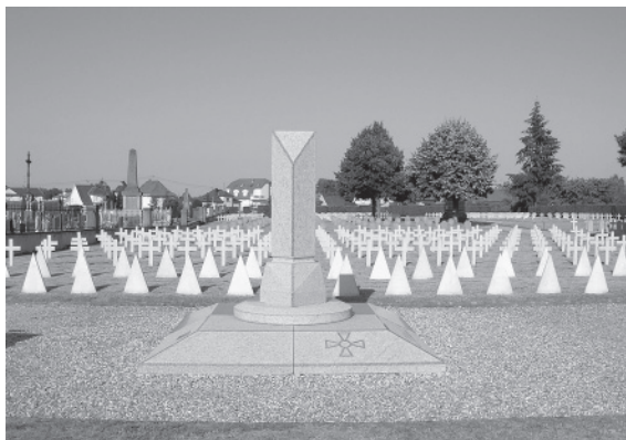
Кресты и пирамидки на могилах русских солдат императорской и советской армии, памятник русским солдатам двух мировых войн на кладбище г. Агно.

Установлены 28 апреля 2005 года консульством России в Страсбурге