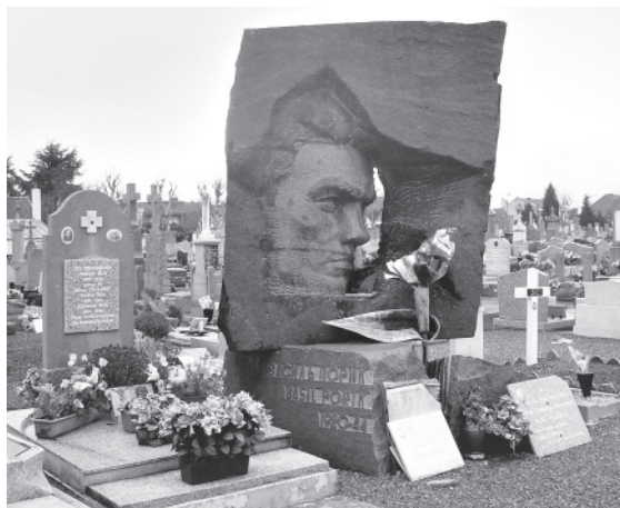
Памятник Герою Советского Союза Василию Порику. Первый из советских памятников, установленный во Франции (1968 г.). Энан-Бомон (Па-де-Кале)

Министерство обороны СССР проводило учёт похороненных во Франции советских солдат уже в годы перестройки, но при этом напрочь игнорировало могилы Первой мировой войны даже на смешанных русско-советских военных кладбищах. На военном некрополе Пьерпон (департамент Мёрт и Мозель) похоронено 493 солдата, погибших в Первую мировую войну, и 58 — погибших во Вторую мировую, но Министерство учитывает только последних. Или взять крупнейший русский военный некрополь во Франции в г. Мец (департамент Мозель), где похоронено 1280 русских и 443 советских солдата, — Министерство упоминает только одну из двух братских могил последней войны. В Абурдене, где могилы солдат двух войн расположены вперемешку, советский военный атташе переписал только фамилии, относящиеся ко Второй мировой. Учётная карточка датирована июлем 1991 года, но до сих пор не претерпела ни-